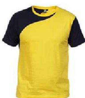
Ibiza (taille M au XXL)