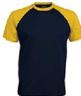
Baseball (S au XXXL)