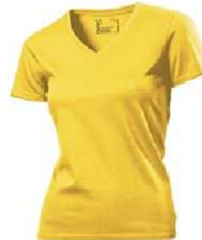
Women's V-Neck (S au XXL)

Ces maillots seront floqués au logo du club et pourra être accompagné d'une personnalisation. Le club a pris l'option de commander plus de teeshirts que le nombre de réservations. Alors pour les têtes en l'air ou ceux qui seraient finalement intéressés au vu de la marchandise, il est encore temps de passer commande auprès du Prés'!